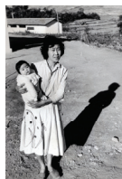
Descrição: Esta foi a mãe que deu a luz à primeira criança nascida na fazenda Capivari e os novos colonos vieram com esperança de vencer... e venceram Tema: Assessoria da Revisão Agrária de São Paulo - Fazenda Capivari Local: Campinas Material: Ampliação, preto e branco, gelatina e prata Formato: 18 x 24cm Nº Topográfico: MI_ICO_ ALB_007_017_012_001