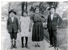
Descrição: Imigrantes japoneses. São Paulo, década 1930 Tema: Não consta Local: São Paulo Formato: 18 x 24cm Nº Topográfico: MI_ICO_ AMP_008_001_062_001