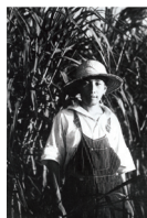
Descrição: Não consta COL.: Museu da Imigração Material: Ampliação, preto e branco, gelatina e prata Formato: 18 x 24cm Nº Topográfico: MI_ICO_ AMP_043_002_034_001